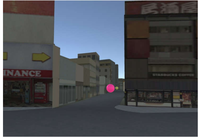
Fig. 2: Ambiente Virtual.

mas na direção contrária. A caixa tem 2.3 metros em cada lado para reduzir a claustrofobia enquanto o utilizador viaja. Foi desenvolvida com a intenção de não mostrar ao utilizador que ele está ser movido, para reduzir a desorientação que pode ser sentida depois de ser movido.