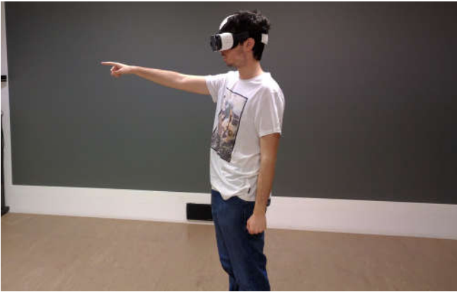
Fig. 3: Participante de um teste de utilizador.

graus e é composto de um smartphone Samsung Galaxy S7, com uma resolução de 2560x1440 pixels e taxa de atualização ( refresh rate ) de 60 Hz. O smartphone também possui sensores de movimento na forma de um giroscópio e um acelerómetro que permite aos utilizadores mover a cabeça usando 3 graus de liberdade dentro do ambiente virtual.