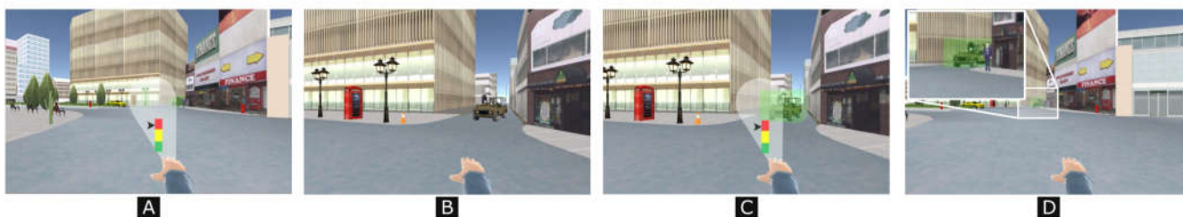
Fig. 5: Técnica de seleção para objetos fora do alcance. A) Cone a intersectar vários objetos. B) Refinamento. C) Seleção de um único objeto. D) Fase final com objeto selecionado.

Após a fase de refinamento progressivo, e a consequente seleção do objeto, o utilizador regressa à posição inicial e o objeto permanece selecionado. A Figura 5 representa todo o processo de seleção. Em 5 A o cone a intersecta vários objetos, e o processo de refinamento vai ser ativado e a posição do utilizador vai ser alterada para mais próximo dos objetos (Figura 5 B). Depois da posição ter sido alterada (Figura 5 C), o utilizador utiliza de novo o cone para selecionar o objeto que pretende. Finalmente, o utilizador retorna à posição inicial e o objeto fica selecionado (Figura 5 D).